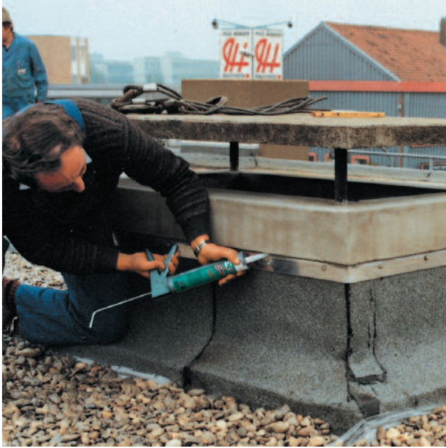
Elastisches Schließen von Anschlussfugen an einem Kamin zwischen Beton und Edelstahlverwahrung.