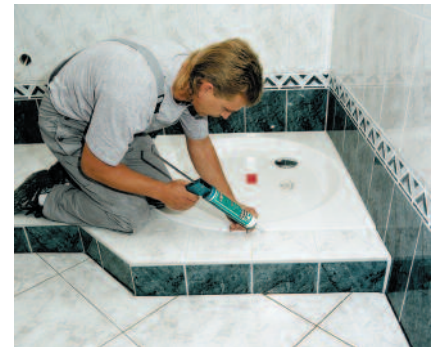
PCI Silcoferm® S härtet geruchsneutral aus.